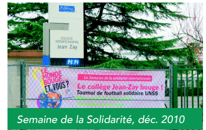
Semaine de la Solidarité, déc. 2010

Dès 1994, les Collégiens se mobilisent pour participer activement au Téléthon , un chèque est donné en direct à la télévision à Évry !