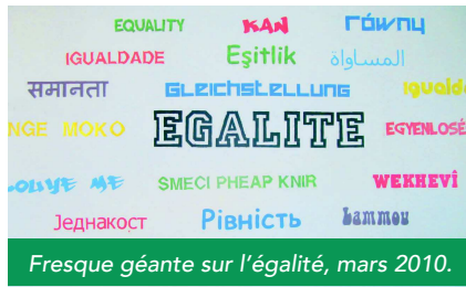
Fresque géante sur l'égalité, mars 2010.