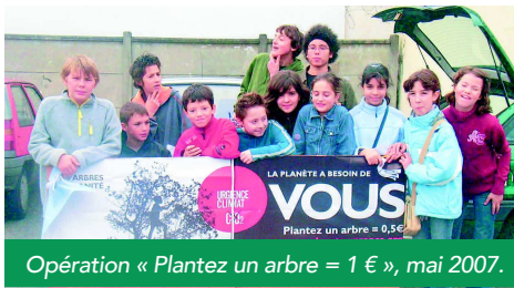
Opération « Plantez un arbre = 1 € », mai 2007.