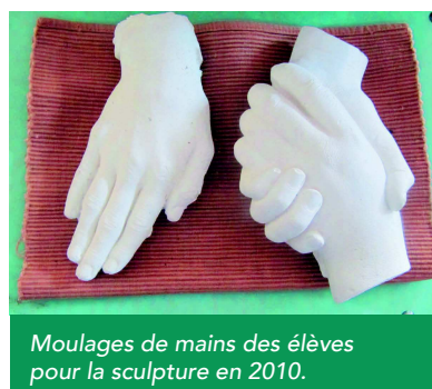
Moulages de mains des élèves pour la sculpture en 2010.

La sculpture monumentale symbolisant la nécessité du « vivre ensemble » sur notre Planète a été inaugurée en juillet 2010 le long de la rue Jules Vallès à l'intérieur du Collège.