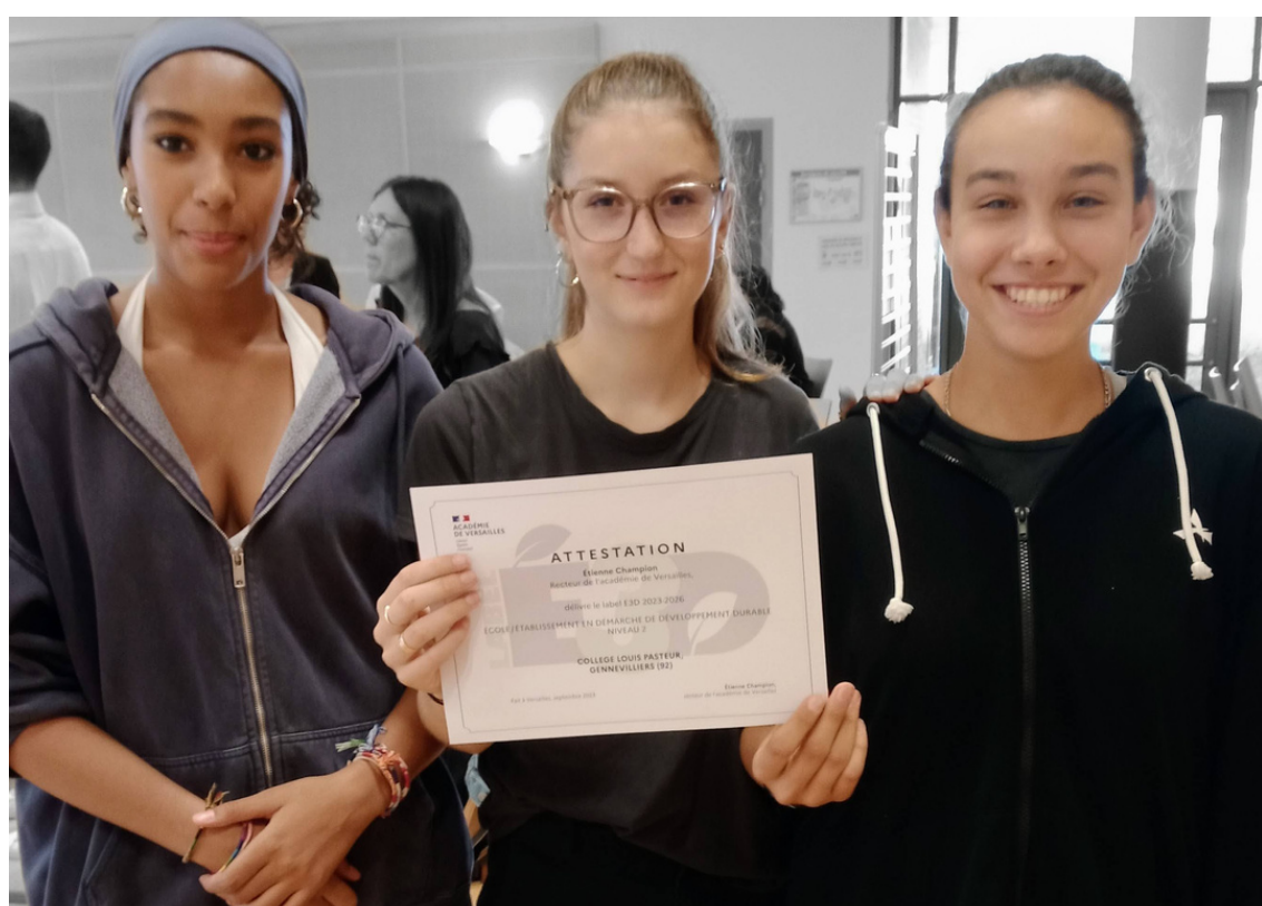
Les éco-déléguées du collège Louis Pasteur de Gennevilliers

L'école devient ainsi un lieu de la transition écologique dans son fonctionnement , par l'action des élèves et de la communauté éducative, en lien avec les partenaires du territoire. Plusieurs champs peuvent être investis tels que l'alimentation, la biodiversité, les déchets, l'eau, l'énergie, les mobilités, le numérique... vous les retrouverez dans ce guide .