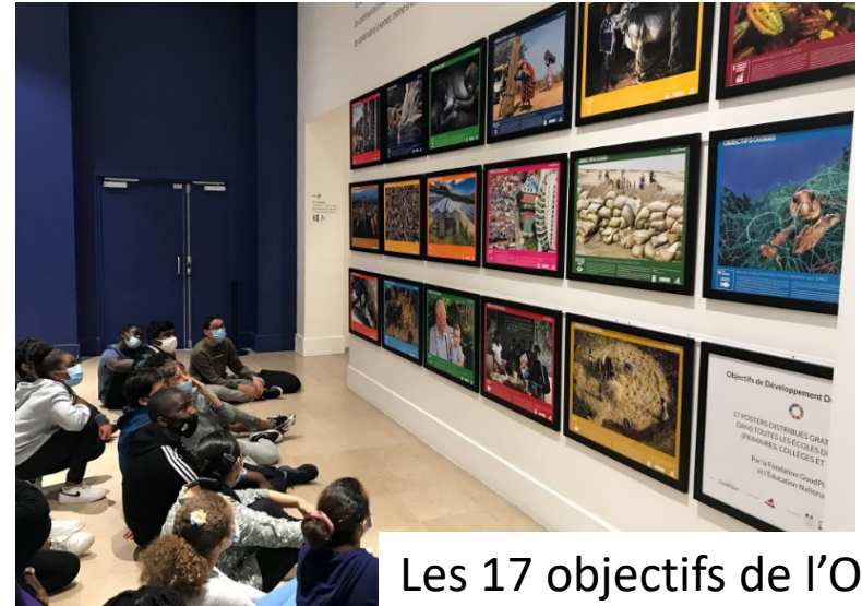
Les 17 objectifs de l'ONU