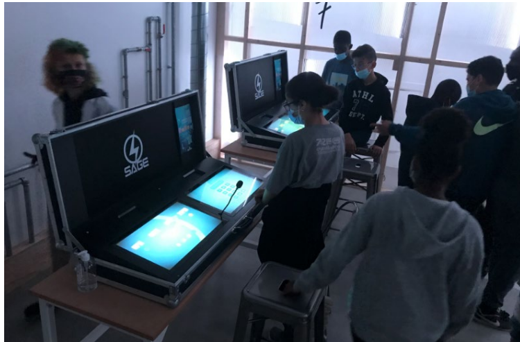
Mission énergie : Escape Game

Sortie à la fondation GoodPlanet, domaine de Longchamp