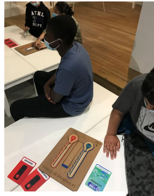
Jeu sur le mix énergétique (1000 bornes)