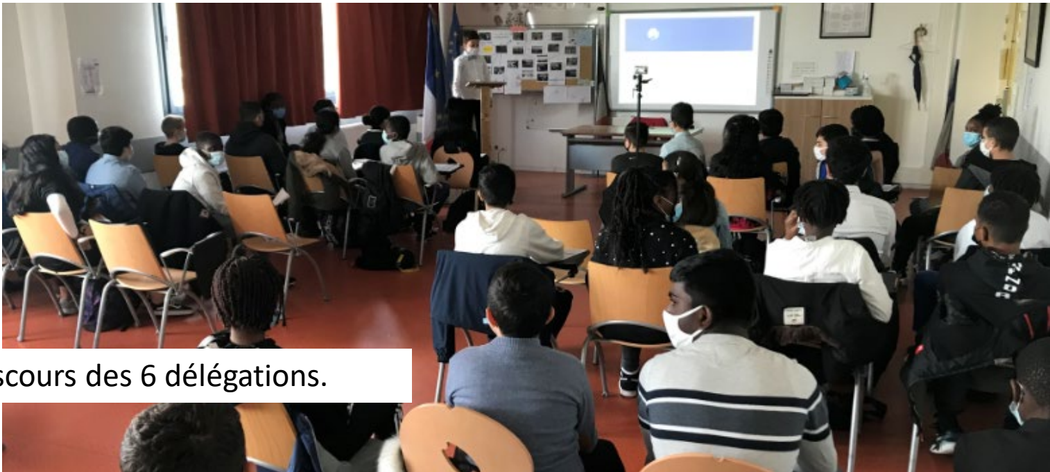
Discours des 6 délégations.